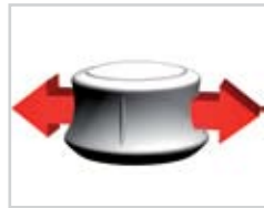
Bewegen nach rechts/links

Zur Steuerung einfach die Controller-Kappe drücken, ziehen, drehen oder kippen.